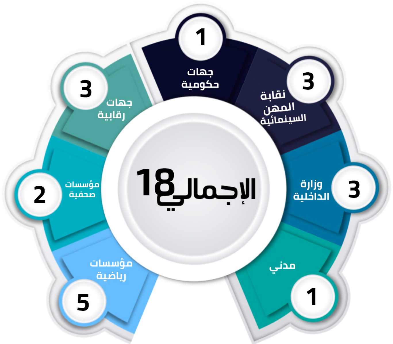
شكل رقم (6) توزيع الانتهاكات وفقاً لجهة المعتدي

جاءت المؤسسات الرياضية في المرتبة الأولى للفئات الأكثر انتهاكاً لممثلي وسائل الإعلام بواقع (5) حالات، وجاءت في المرتبة الثانية كلاً من وزارة الداخلية ونقابة المهن السينمائية وجهات رقابية بواقع ثلاث حالات، وفي المرتبة الثالثة المؤسسات الصحفية بواقع حالتين انتهاك، والفئات الأخرى بواقع حالة انتهاك لكل من جهات حكومية ومدنيين.