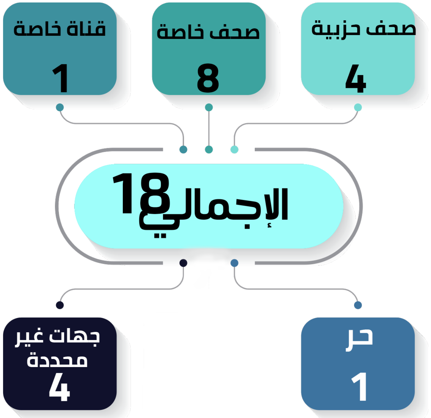
شكل رقم (4) توزيع الانتهاكات وفقاً لجهة عمل الصحفي/الإعلامي

سجل "المرصد" وقائع لعدد من الصحفيين العاملين بقطاعات مختلفة سواء شبكات أخبار، أو صحف مصرية أو قنوات مصرية خاصة وحكومية؛ حيث رصدت الوحدة (8) حالات ضد العاملين بالصحف الخاصة، و(4) حالات لجهات غير محددة نظراً للانتهاكات الجماعية، ومثلهما ضد العاملين بالصحف الحزبية، وأخيراً حالة وحيدة ضد العاملين بإحدى القنوات الخاصة ومثلها ضد كاتب صحفي حر.