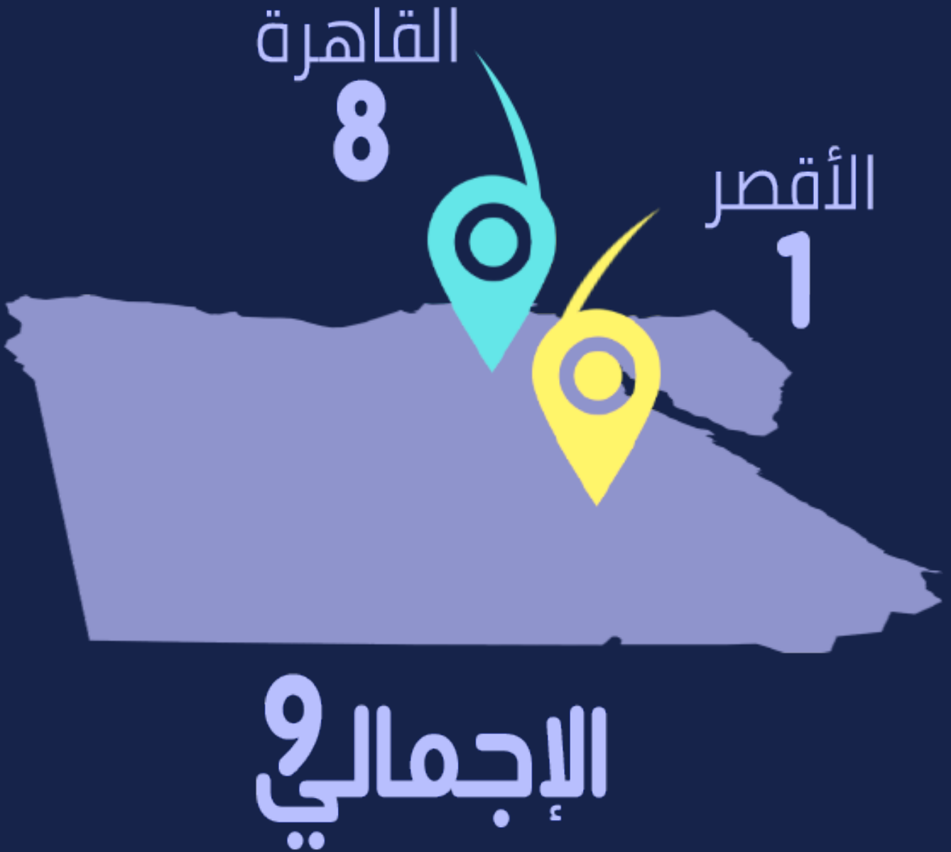
شكل رقم (7) توزيع الانتهاكات وفقاً للنطاق الجغرافي

على الصعيد الجغرافي، سجلت الوحدة عدد (9) حالات انتهاك خلال مارس 2019 بواقع (8) حالات في محافظة القاهرة، مقابل حالة انتهاك بمحافظة الأقصر.