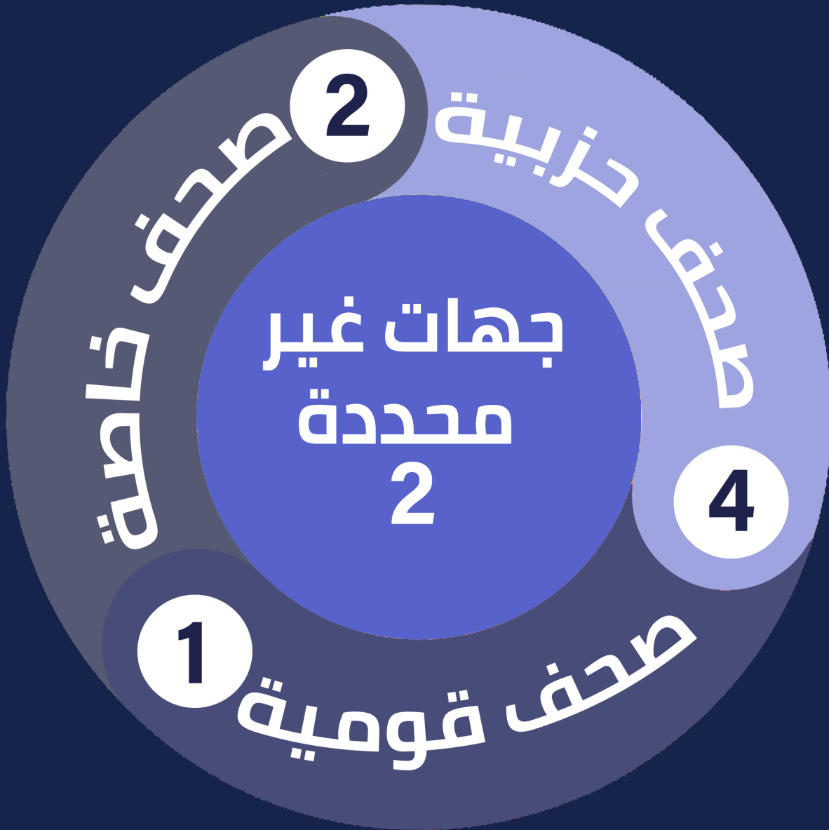
شكل رقم (4) توزيع الانتهاكات وفقاً لجهة عمل الصحفي/الإعلامي

سجل "المرصد" وقائع انتهاكات لعدد من الصحفيين العاملين بقطاعات مختلفة سواء شبكات أخبار، أو صحف مصرية أو قنوات مصرية خاصة وحكومية؛ حيث رصدت الوحدة 4 حالات ضد العاملين بالصحف الحزبية، واثنتين لجهات غير محددة نظراً للانتهاكات الجماعية ومثلهم ضد العاملين بالصحف الخاصة، وحالة واحدة ضد العاملين بالصحف القومية.