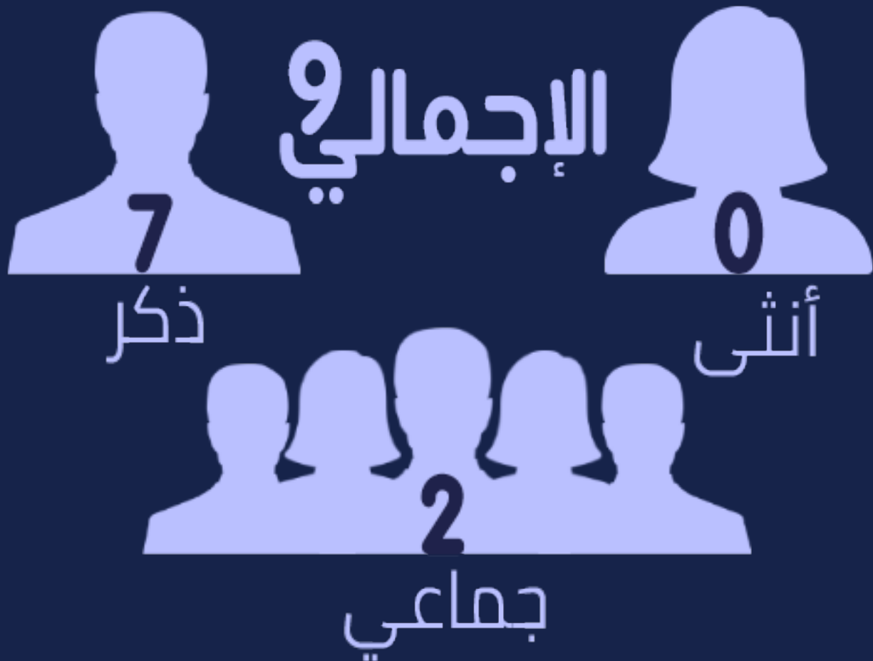
شكل رقم (2) توزيع الانتهاكات وفقاً للنوع الاجتماعي/الإعلامي

سجل "المرصد" عدد (7) حالات انتهاك ضد الذكور، وحالتين انتهاك جماعي لم يتسن لنا معرفة نوعهم الاجتماعي، في حين أننا لم نرصد حالات انتهاك ضد الإناث.