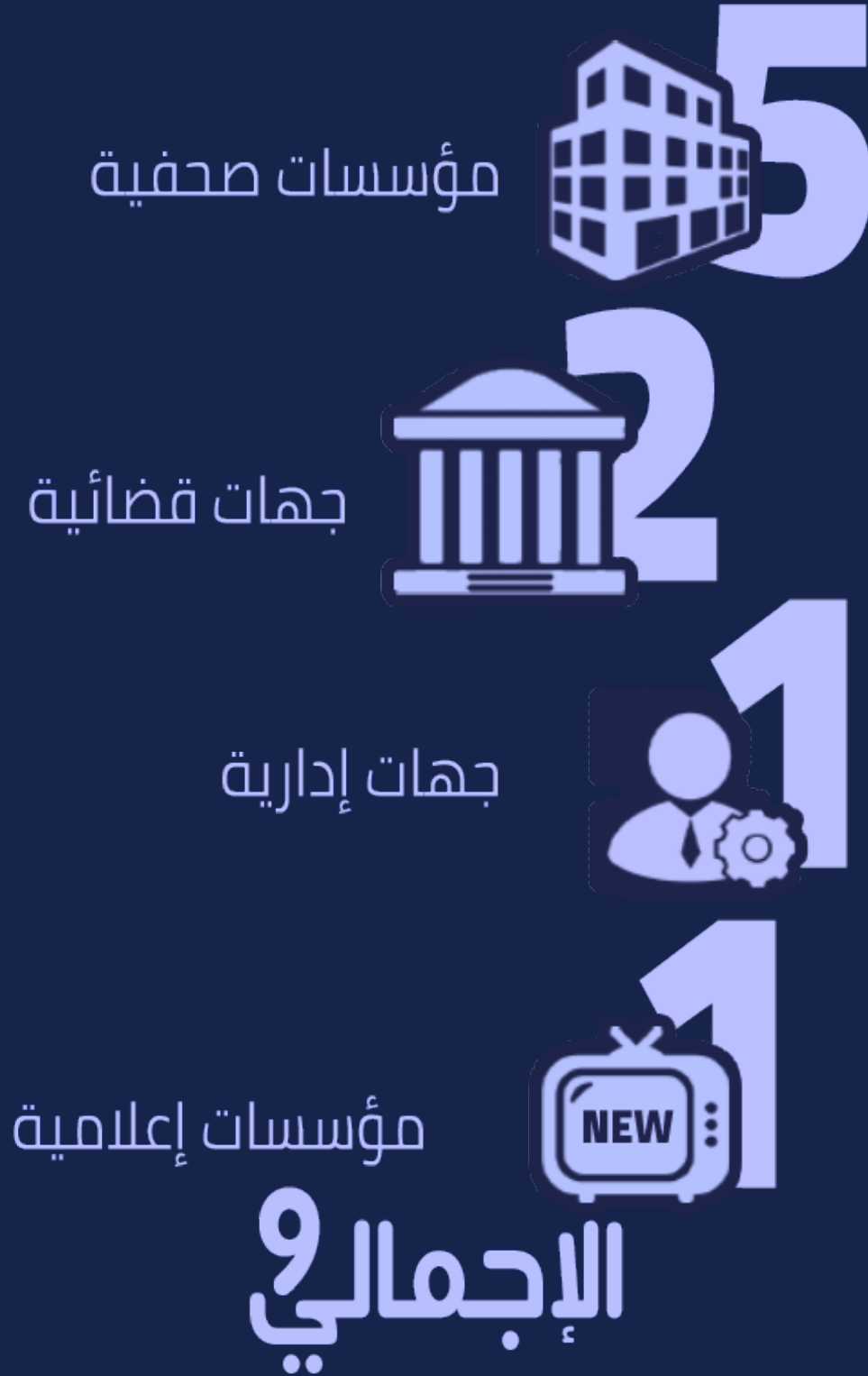
شكل رقم (6) توزيع الانتهاكات وفقاً لجهة المعتدي

جاءت المؤسسات الصحفية في المرتبة الأولى للفئات الأكثر انتهاكاً لممثلي وسائل الإعلام بواقع (5) حالات، وجاءت جهات قضائية في المرتبة الثانية بواقع حالتين، وجاءت كل من جهات إدارية، ومؤسسات إعلامية بواقع حالة انتهاك واحدة.